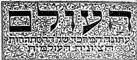
הגיליונות שראתו להקים מקלט בטוח במשפט פומבי לעם ישראל בארץ ישראל (תמונה בזמן)

הפרסום ב"העולם" כשנדעו ממדיה האמיתיים של השואה באירופה, שלהי נובמבר 1942